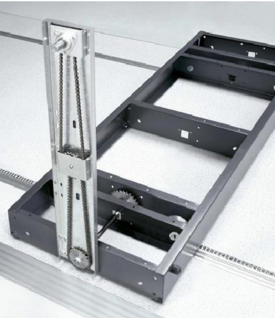
podvozok a koľajnice s reťazou

súčasťou dodávky regálu je jeho označenie. označenie je formátu A4 ( 210x 297mm). pevná podložka s priehľadným obalom, do ktorého sa dá vkladať hárok papiera formátu A4. Papier sa dá ľahko meniť, aby sa obsah mohol podľa potreby aktualizovať. spôsob uchytenia pevnej podložky je realizovaný tak, aby nezasahoval do priestoru uskladňovaných premetov.každý jeden regál má vlastné označenie.