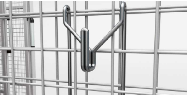
systém dvojitého sita a háčik na vešanie - malý háčik Ø 2,5mm /nosnosť 50kg/ veľký háčik Ø 4mm /nosnosť 100kg/